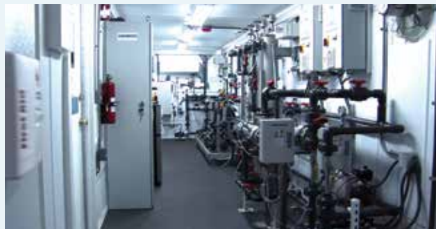
Unité pilote avec intérieur climatisé