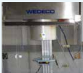
Appareil à faisceaux UV collimatés