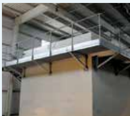
Bassin d'essai à aération