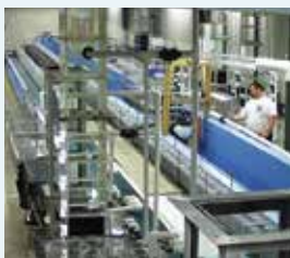
Centre de développement des produits Leopold